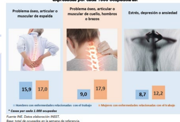
Imagen 2. Trabajadores que consideran que los TME o afecciones mentales son los problemas más graves que sufren causados o agravados por el trabajo. Frecuencias expresadas por cada 1000 ocupados/as.

En todas las ocupaciones la afectación de los TME es sensiblemente superior entre las mujeres, aunque en Servicios de salud y cuidado a las personas, la diferencia en la frecuencia de afectación entre mujeres y hombre es más pequeña.